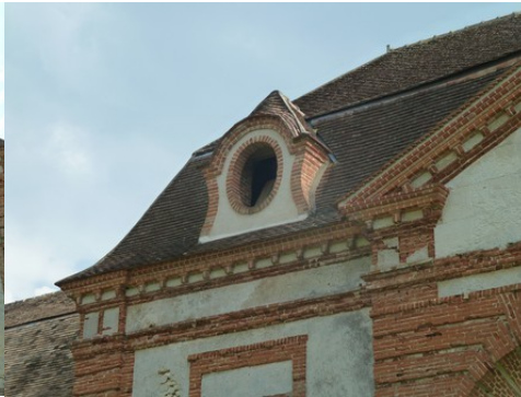
Une lucarne (détail)