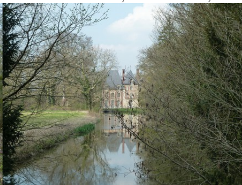
Le château sur un bras de l'Eure