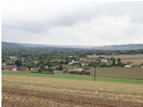
Une vue sur la vallée de l'Eure