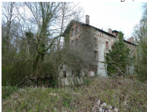
Le moulin situé aux abords des communs

Les avis seront cohérents avec ceux émis ces dernières années, à savoir : pas de maisons à volume compliqué (type V, W, Y, ou Z), pentes à 45° pour les volumes principaux, ardoise ou tuile plate de teinte brun vieilli, à 20u/m 2 , avec un débord de toiture de 20cm, enduit de teinte beige clair avec modénatures (au choix : chaînages, encadrement de fenêtres, soubassement, colombage...). *Voir les autres fiches.