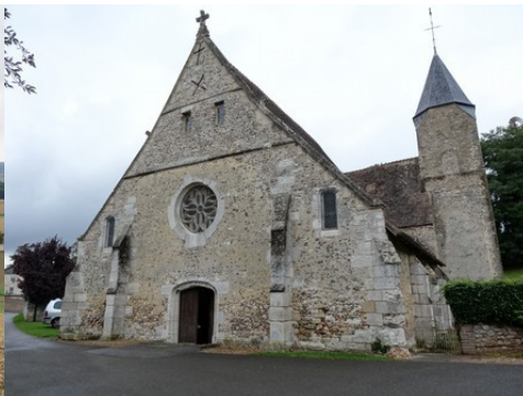
L'église de Chambray