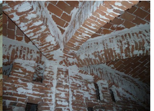
Les voûtes en briques des communs