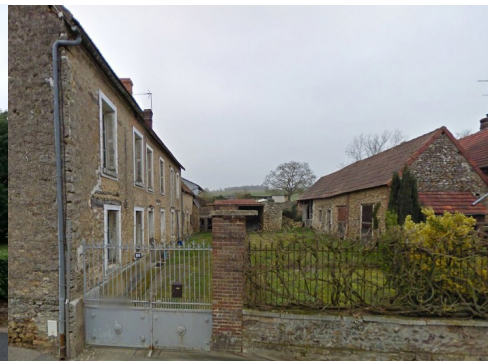
Le bâti rural à Chambray