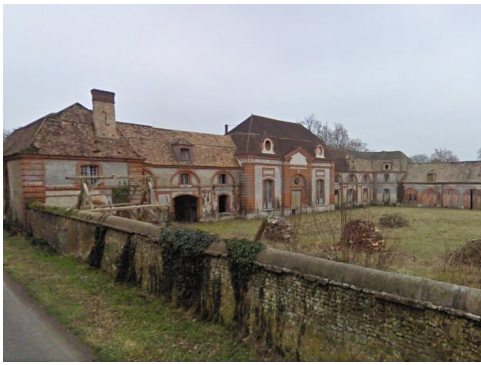
Les communs vus de la route