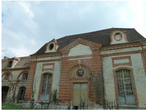
Le pavillon central (aile sud-est)